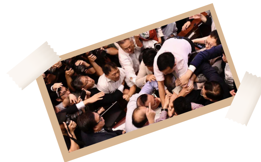
新香港用户组联络员 1233 在电报 (Telegram) 上澄清道香港用户组的立场与这篇新闻报道近似。

香港维基社群用户组极度关注此法案可能带来的后果，并呼吁各方保持理性、克制。我们也希望政府能够暂时撤回上述法案，并以适当的方式咨询市民，团体及各持份者，聆听他们的意见，并解决社会上关于上述法案的疑虑为止。