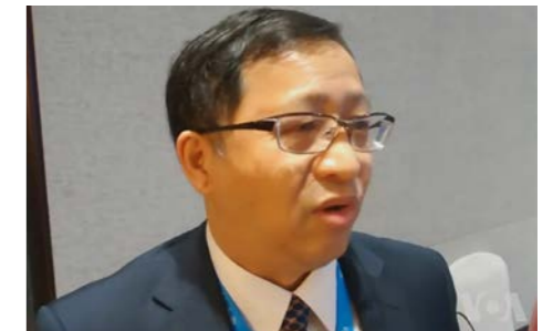
“墙”的缔造者——方滨兴

【《求闻》北京 5 月 25 日讯】中国大陆维基人用户组负责监视网络情况的小组证实，自 2019 年 4 月 23 日所有语言维基百科在中国大陆无法访问以来，5 月 9 日出现了屏蔽扩大的情况。4 月 23 日的屏蔽只针对各个语言的维基百科，但诸如维基语录、维基共享资源、元维基等其他维基媒体计划没有受到影响。自北京时间 5 月 9 日早晨开始，全国解析维基媒体基金会旗下除维基百科外的其他项目时，也出现了 DNS 解析结果被污染的情况。这一污染在 9 日全天断断续续，各地区、域名受污染情况不一。这使得在未经过任何特殊配置的设备上，直接访问除维基百科外的其他维基媒体计划连接不稳定。这一污染在 9 日晚间逐步解除，次日完全恢复正常。我们认为这有可能是审查机构技术出错所致。