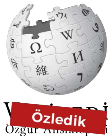
土耳其语维基百科现在使用的 logo。红色遮挡框上写有“我们想你”