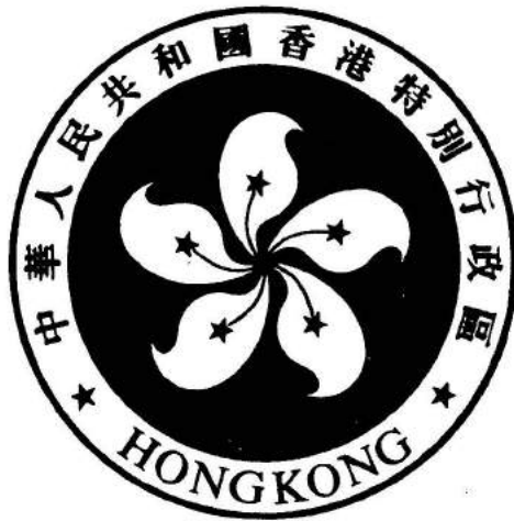
香港特别行政区区徽图案