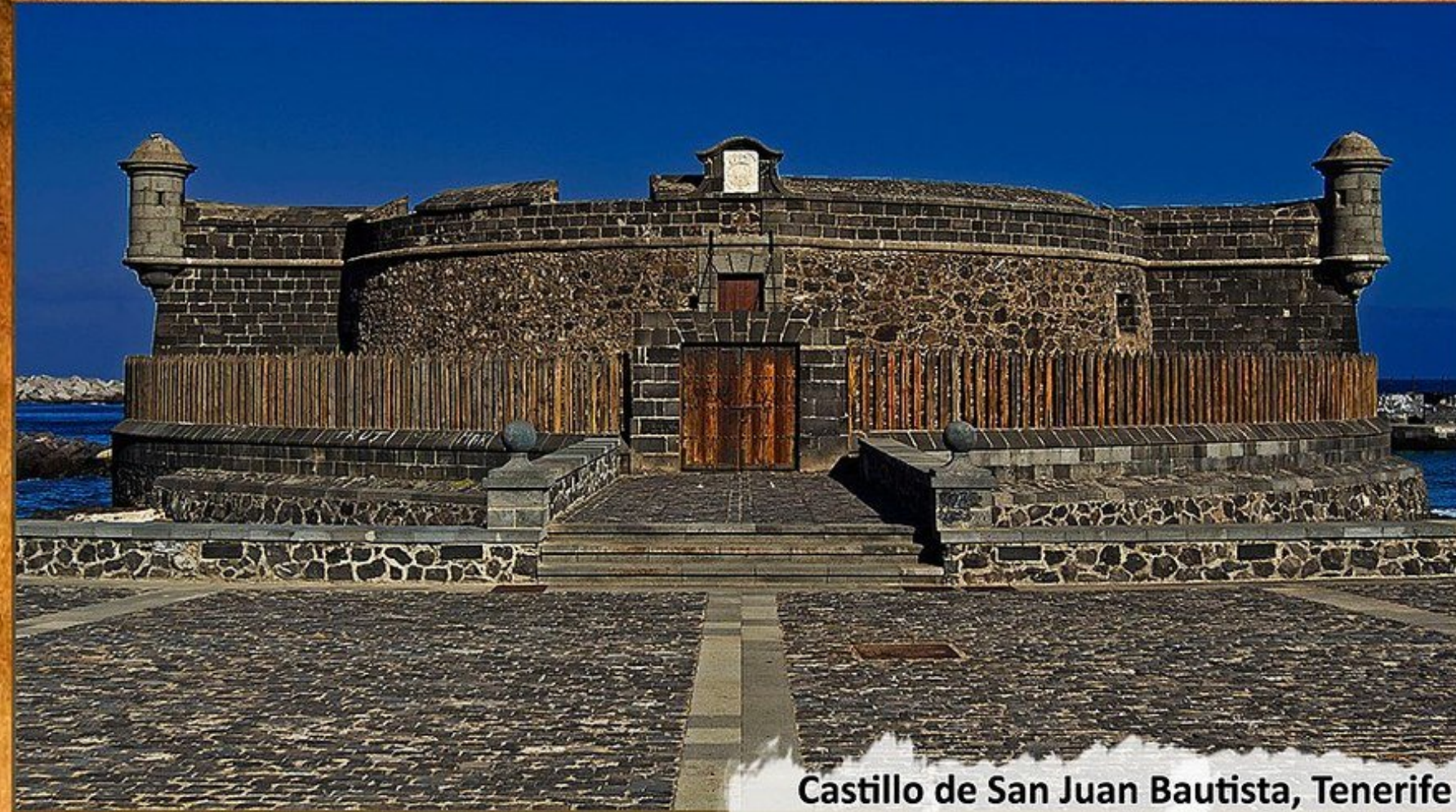
Castillo de San Juan Bautista, Tenerife